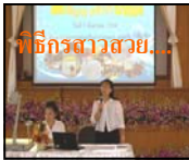
พิธีกรสาวสวย...

KM สัญจร ครั้งที่ 5 เรื่อง การฝึกทักษะเป็น วิทยากรกระบวนการ ครั้งที่ 1 เมื่อวันที่ 5 สิงหาคม 2554