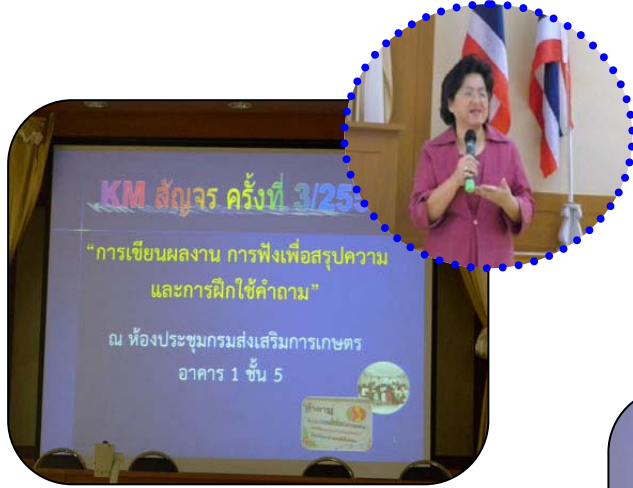
ผู้อำนวยการกองวิจัยและพัฒนางานส่งเสริมการเกษตร เป็นประธานในเวที KM สัญจร