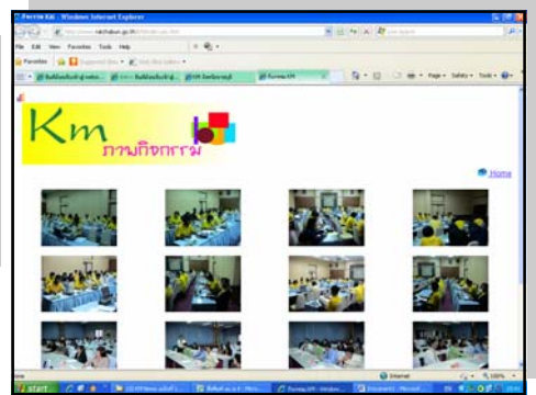
KA หลากหลายความรู้ด้านไม้ผล ของจังหวัดระนอง